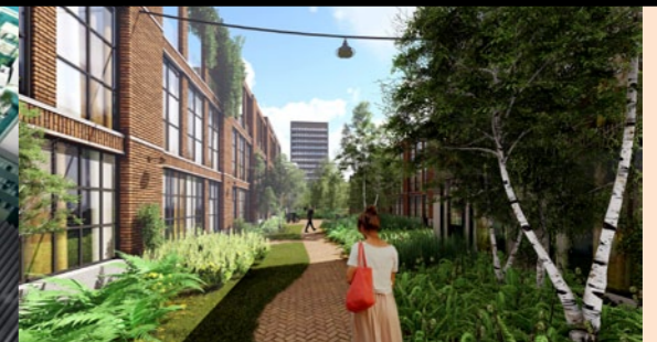
Fabriekskwartier Tilburg: circa 400 woningen