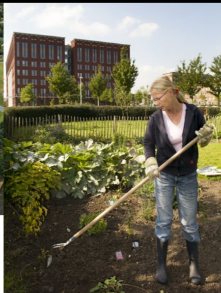
KERKOR OUBEN ©