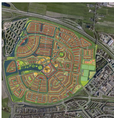
Nieuwland in Amersfoort

geleden was dat niet vanzelfsprekend. Je moet als stedenbouwer visionair en trendsettend durven zijn en altijd voor de lange termijn gaan.'