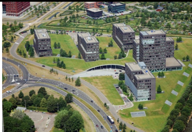
Kantorenpark Papendorp, Leidsche Rijn